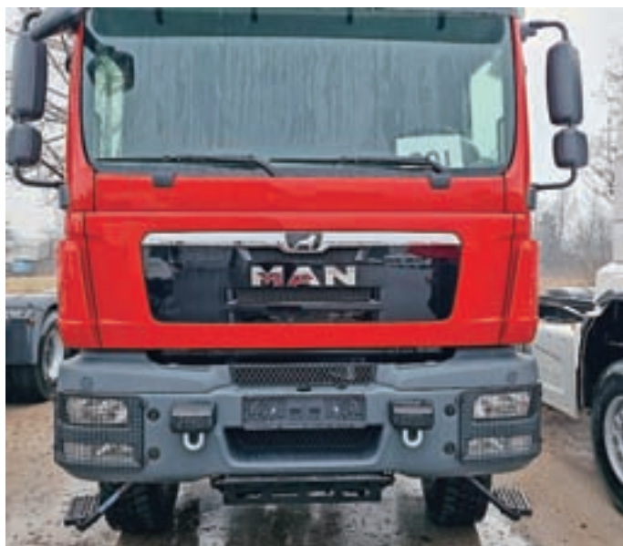
Podvozje vozila čaka na nadgradnjo.

Nova gasilska avtocisterna PGD Dobračeva bo zaradi velike količine gasilne vode (7 m 3 ) in ostalih gasilnih sredstev delovala ob manjših in večjih požarih na stanovanjskih in industrijskih objektih, pri požarih v naravi ter za oskrbo požarišča z vodo. Opremljena bo z gasilsko reševalno opremo po zahtevah tipizacije gasilskih vozil ter z dodano opremo, ki jo gasilci potrebujemo na intervencijah. Bo edina gasilska avtocisterna v občini in bo močno izboljšala požarno varnost meščanov in gospodarskih družb.