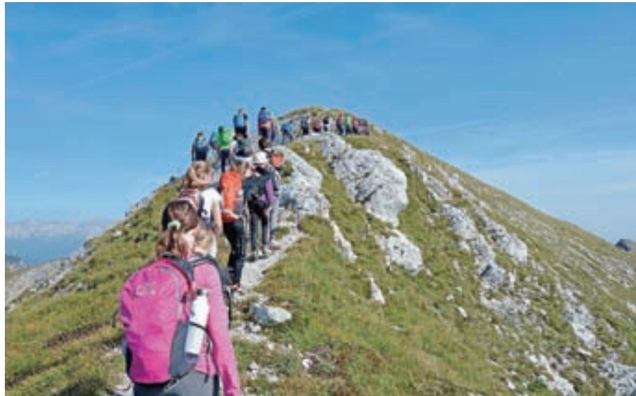
Učenci so uživali v lepotah slovenskega gorskega sveta.

Termin izvedbe je vodstvo šole prilagodilo vremenskim razmeram in so tako pod vodstvom svojih učiteljev, gorskega reševalca in strokovne medicin-