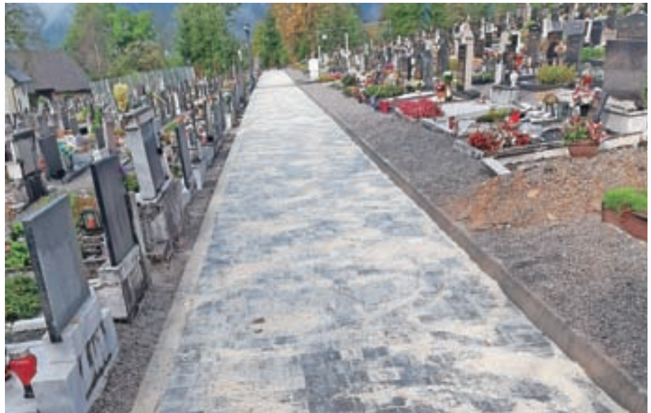
Na pokopališču urejajo dostopne poti.

Na srednji dostopni poti je bilo izvedeno polaganje betonskih tlakovcev z izkopom in odvozom zemljine. Ureditev zgornje dostopne poti v dolžini šestdeset metrov bo izvajalec začel predvidoma ta mesec. Dela vključujejo izvedbo opornega zidu in vgradnjo betonskih robnikov vključno z drenažnim odvodnjavanjem.