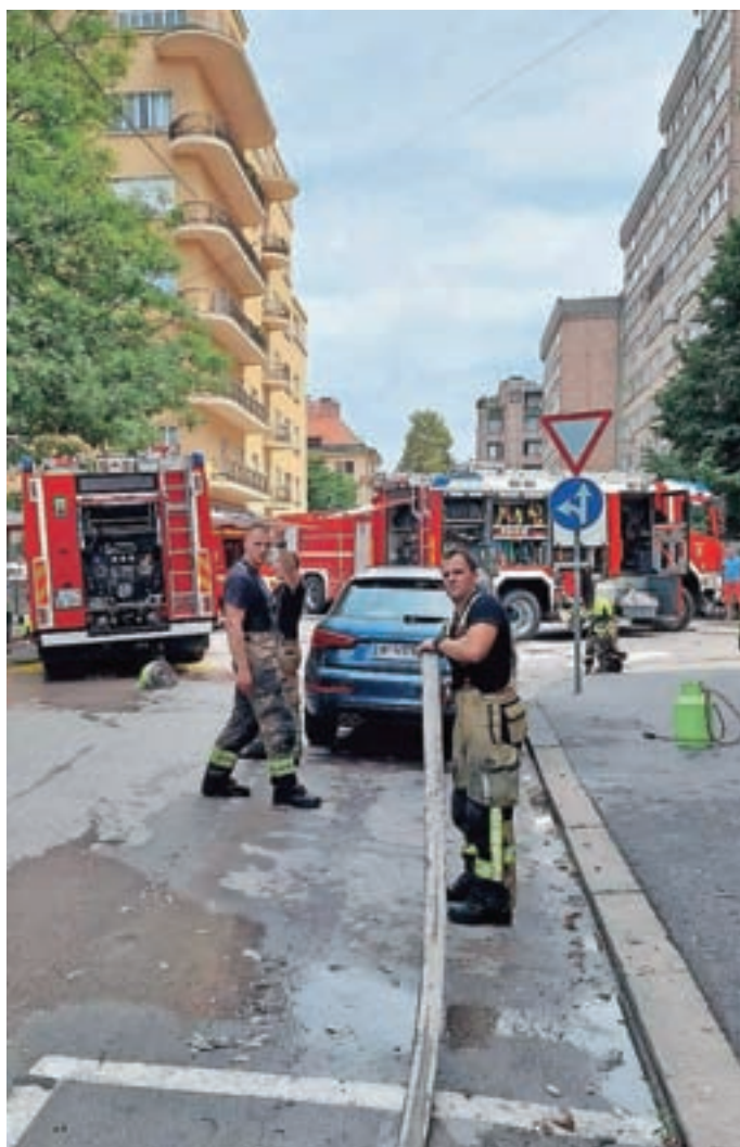
Posredovanje ob požaru na ostrešju v centru Ljubljane

Ljubljana. Enkrat smo prejeli klic, da se je starejšemu gospodu zarastel prstan v prst. Odhiteli smo na urgenco, kjer so nas gospod in ekipa PNMP že čakali. Gasilci imamo namreč prav takšno orodje, ki je primerno za odstranjevanja prstana ali podobnih manjših predmetov. Z ekipo smo začeli rezati prstan. Takšno delo poteka zelo počasi in zbrano. Ko smo bili že skoraj pri koncu, sem gospodu dejal, naj še malo potrpi in stisne zobe. V tistem se je gospod obrnil k meni in z nasmehom odgovoril: "Fant, kaj se delaš norca, ali ne vidiš, da sem brez zob?" Ker smo se tako smejali, smo morali začasno prekiniti delo. Kasneje pa smo prstan uspešno odstranili. Na drugi strani pa so tiste, ki so zares težke, dolge in naporene, kot je bila na primer intervencija s požarom ostrešja v centru Ljubljane nekaj mesecev nazaj. Najbolj močno pa se te dotaknejo tiste, v katerih so udeleženi otroci.