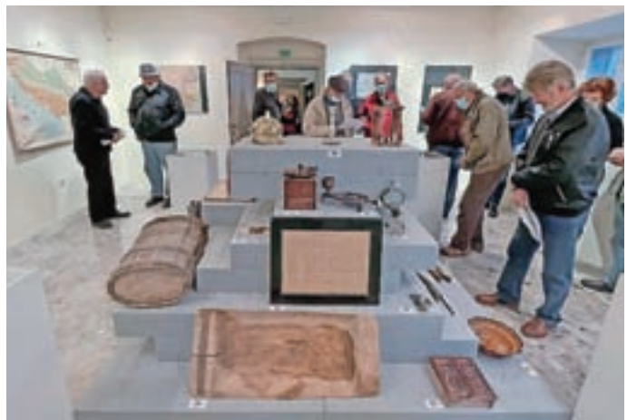
V Muzeju Žiri si je mogoče ogledati razstavo 50 muzejskih predmetov ob 50-letnici Muzejskega društva Žiri.