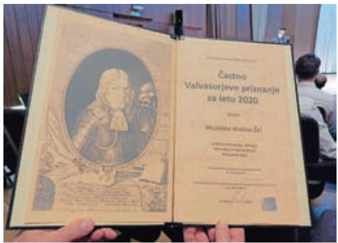
Častno Valvasorjevo priznanje Muzejskemu društvu Žiri za leto 2020