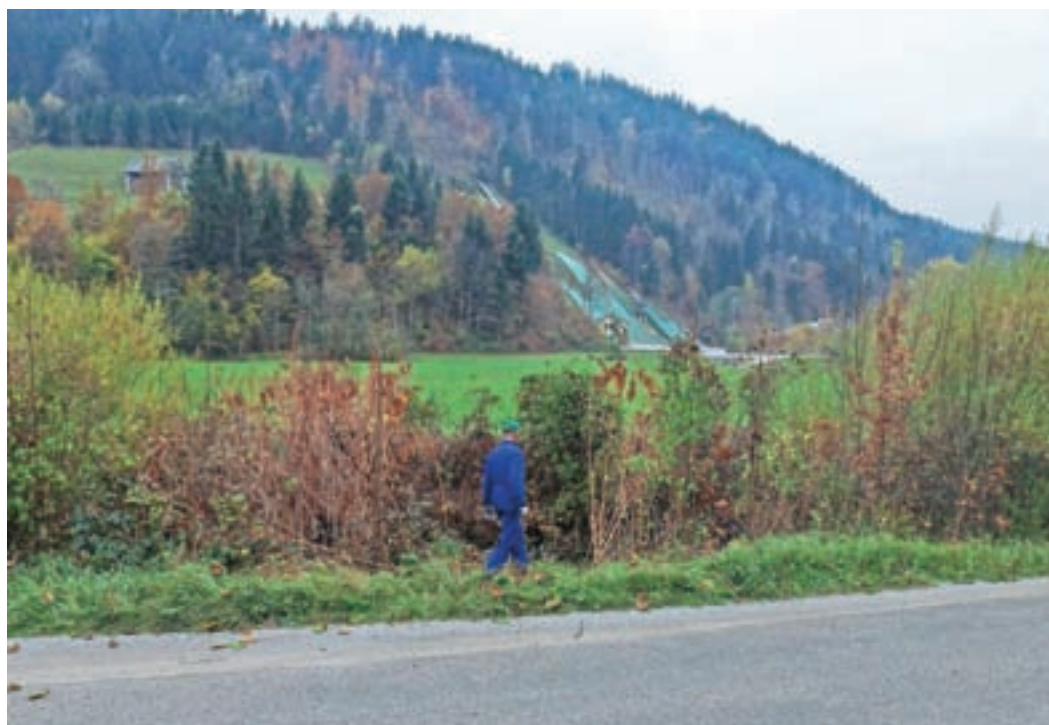
Pilotno akcijo odstranjevanja japonskega dresnika so izvedli v Račevi.

Akcije organiziranega odstranjevanja ITR so pomembne, ne samo zaradi konkretnega učinka, temveč tudi ali predvsem, da se opozori na prisotnost ITR, pokaže potrebo in pripravljenost po dejanskem ukrepanju in s tem spodbudi ljudi, predvsem tiste, ki še niso sodelovali, da se vključijo tudi sami in da so dejavni na tem področju tudi izven takih akcij. Ker imamo v Žireh že uspešno, dobro utečeno vsakoletno akcijo pomladanskega čiščenja bregov vodotokov v organizaciji Ribiške družine Žiri skupaj z Osnovno šolo Žiri, bi bilo relativno enostavno vsako leto narediti podobno akcijo odstranjevanja ITR, saj se najpogosteje pojavljajo na rečnih/potoških bregovih, njen učinek pa bi bil v boju proti invazivkam, v to sem prepričan, izredno velik. Pri izvedbi bi bila pripravljena z odvozom materiala in podobno pomagati tudi Občina Žiri. Upam, da je bila predhodnica takim organiziranim aktivnostim na terenu "pilotna" akcija odstranjevanja japonskega dresnika v Račevi v okviru projekta Aktivno proti invazivkam (API) Ljudske univerze Škofja Loka konec oktobra, ki je imela predvsem "propagandni" namen, konkretno pa se je s tem naredilo več prostora za uničevanje mladja prihodnje leto. In zakaj ravno japonski dresnik? S svojo agresivnostjo in trdovratnostjo predstavlja veliko nevarnost in je zato nekakšen simbol invazivk. Na srečo ga je v Žireh, kljub več rastiščem v Račevi – ob strugi Račeve