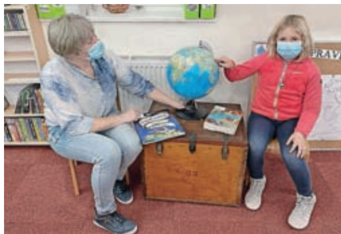
Otroci se vsako prvo sredo v mesecu podajo na potovanje s pravljico v svet.

V Krajevni knjižnici Žiri smo z mesecem oktobrom spet začeli naše prireditve tako za najmlajše kot tudi za starejše. Otroške prireditve imajo že ustaljen urnik, vidimo se v sredo ob petih. Vedno se dogaja kaj drugega: enkrat je na programu pravljica, drugič delavnica, lahko uživamo v nastopu učencev iz žirovskega oddelka Glasbene šole Škofja Loka, uživamo ob pravljicnih rokodelnicah in poslušamo pravljice ter seveda skupaj s psom prebiramo zgodbe in knjige. Vedno je zanimivo in ura še prehitro mine, največkrat nam zmanjka časa. Za uro pravljic sem letos pripravila poseben projekt z naslovom S pravljico v svet iz Krajevne knjižnice Žiri. Letošnje ure pravljic v Žireh so namreč namenjene posebnemu potovanju – domišljjskemu potovanju po svetu skupaj s pravljicami. Na prvi uri pravljic smo predstavili domače pravljice in se tako pripravili na popotovanje. Na-