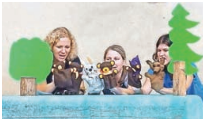
Najmlajše so vzgojiteljice razveselile z igrico Zrcalce.