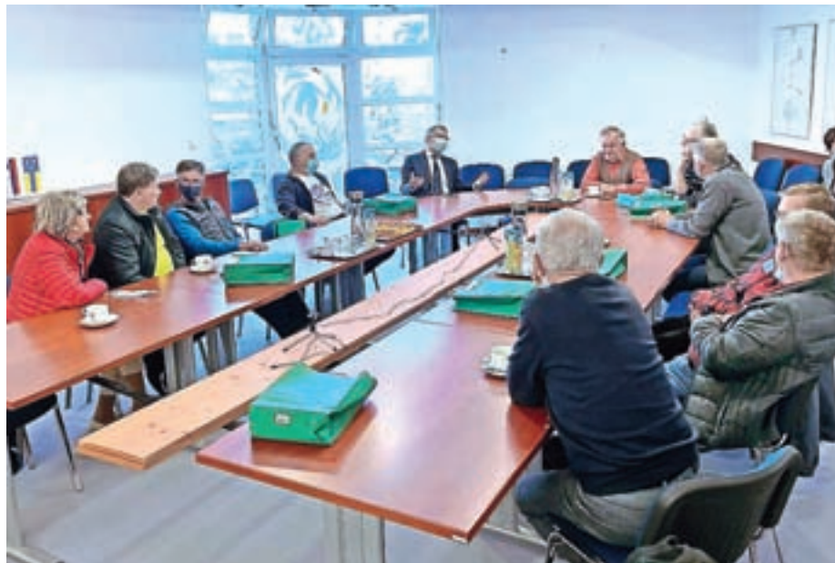
Srečanje žirovskih prostoferjev v prostorih občine

katerega starejšim nudijo brezplačne prevoze na klic. Enajst voznikov prostoferjev je do konca oktobra opravilo več kot 280 prevozov in skupaj prevozilo 28 tisoč kilometrov. Starejši so največkrat potrebovali prevoz na zdravniške preglede v Škofjo Loko, Ljubljano, Kranj in Jesenice. Najdaljši prevoz so opravili do Valdoltre, so pojasnili na občini.