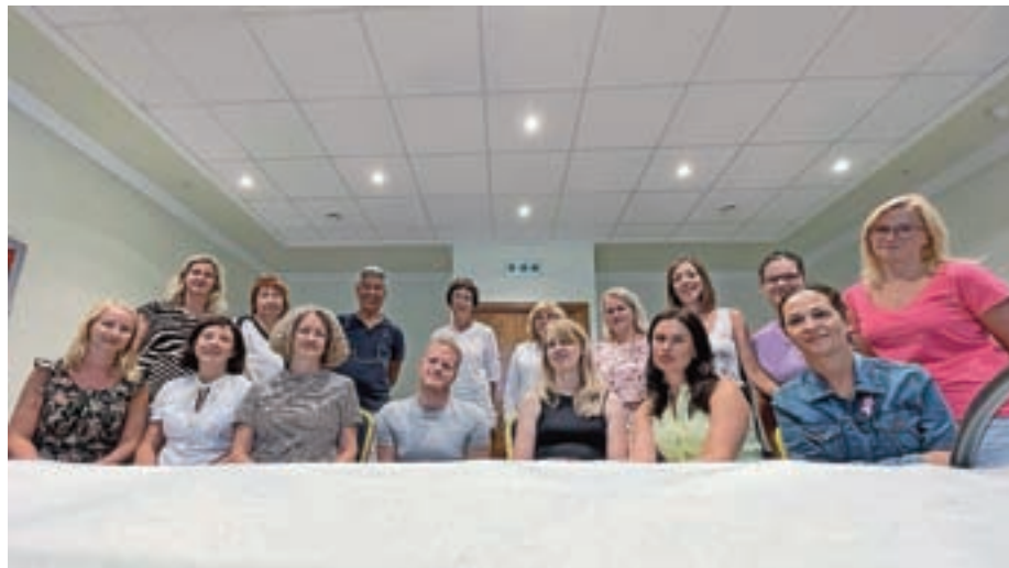
Izobraževanje učiteljev na Malti ...

tično in metodično znanje, opozorjeni smo bili na najbolj pogoste napake, ki se rade pojavljajo in ponavljajo pri poučevanju tujih jezikov, in se seznanili z novimi, sodobnimi metodami, kot so učenje s pomočjo pesmi, zgodb, rim, gibanja ... Vse metode se lahko prilagodi-