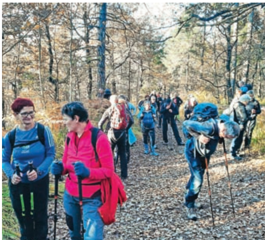
Na pot se je podalo okrog petdeset pohodnikov.

Megleno jutro so kmalu zamenjali sončni žarki, prvi so nas ujeli pod Čičevim gričem, v nadaljevanju po poti do Hrastovega griča pa se je nebo povsem odkrilo in imeli smo prekrasen razgled na okoliške hribe. Kratek počitek, topel čaj in okrepčilo na Hrastovem griču nam je dal novih moči za pot v smeri proti Kladju, s spustom na Selo. Nekako polovička je za nami in pred nami kar precejšna strmina, mimo "Paradiža" do pretvornika. To, česar si nam zaradi sopihanja v breg ni