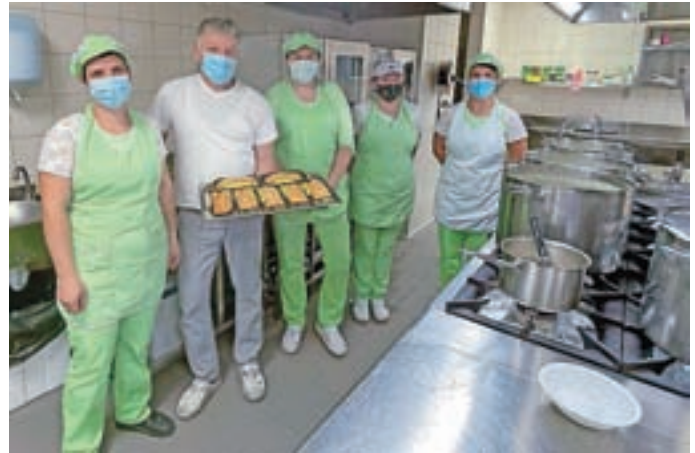
Osebe v šolski kuhinji vsak dan pripravi okrog osemsto obrokov.

Obodno konstrukcijo prostora, ki je namenjen kuhinji in spremljajočemu programu, so postavili že v okviru gradnje celotnega objekta, to je nove večnamenske dvorane in pove-