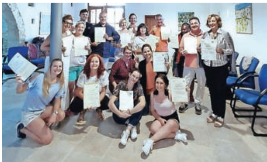
... in na Cipru

jo tako za delo z različnimi starostnimi skupinami kot tudi za delo pri drugih predmetih. Med izobraževanjem smo bili udeleženci večino časa postavljeni v vlogo učencev, kar nam je osvežilo tudi nekatere občutke iz otroštva, na primer, kako težko je sedeti celih pet ali celo sedem ur in pri tem ves čas biti tiho.