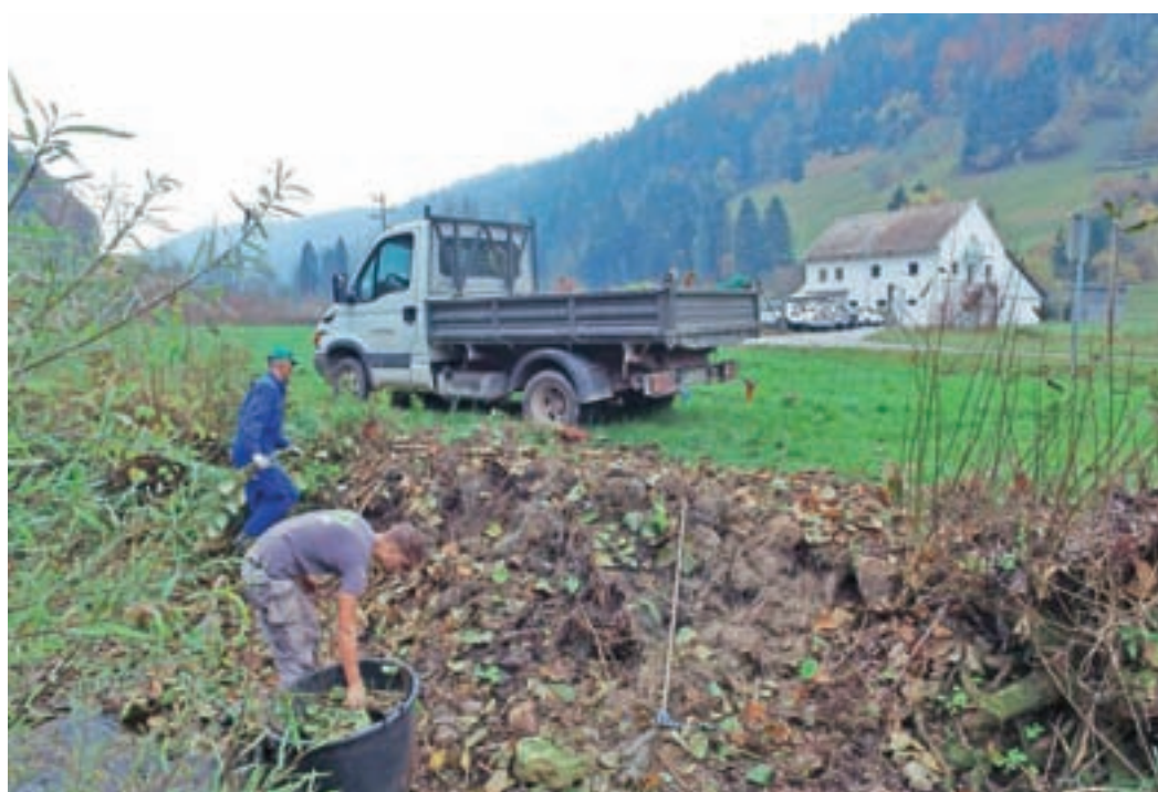
Akcija odstranjevanja japonskega dresnika je potekala v okviru projekta Aktivno proti invazivkam Ljudske univerze Škofja Loka.

– Doslej "pozitivno" sekanje grmovja in drevja ob rekah in potokih lahko pome-