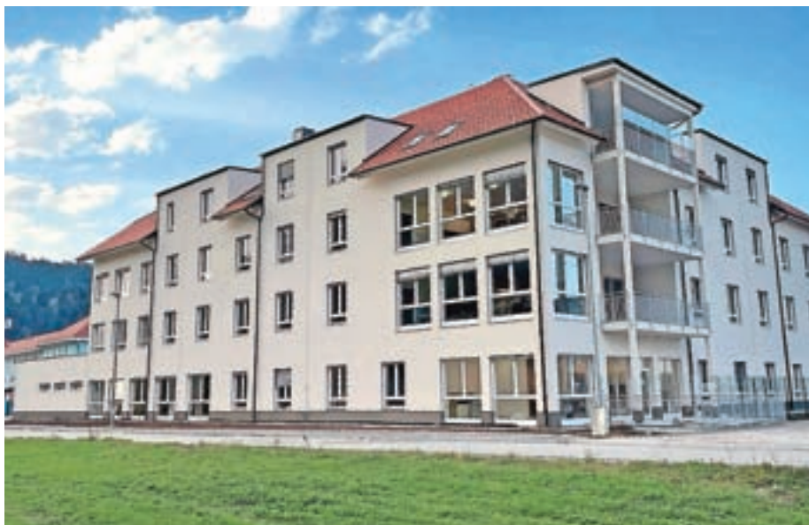
Prve stanovalce v novem domu za starejše bodo začeli sprejemati po novem letu.

V domu bo našlo zaposlitev predvidoma 34 novih sodelavcev. "Veliko vlog je prispelo že brez razpisov, ki pa se bodo kljub temu še ponavljali, ker primanj-