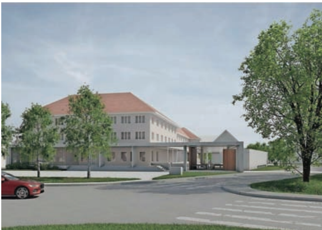
Pogled na novo ureditev središča pred Zadružnim domom

Projekt predvideva tudi precej novih parkirišč, tudi za potrebe doma za starejše. Namesto sedanjih 83 parkirišč, ki so po besedah župana ta čas urejena precej hektično, bi po novem na območju središča dobili 37 parkirišč več. "Iščemo se tudi možnosti za odkup dela parkirišča pri podjetju Alpina, na območju stare telovadnice, ki je predvidena za rušitev, pa naj bi uredili še 27 parkirišč."